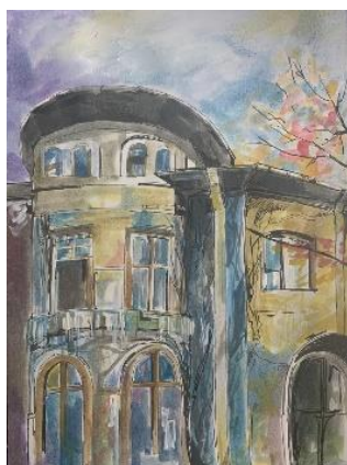
Ploiesti - Detaliu – Casa pe strada Italiana

Oriunde ai pleca, cand te reintorci in orasul natal, cand revezi toate locurile vechi si noi, sentimentul care te cuprinde este cel de siguranta, adica te simti ACASA.