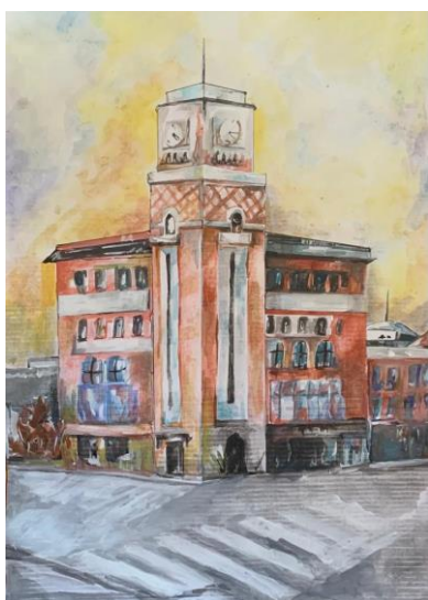
Ploiesti - Halele Centrale